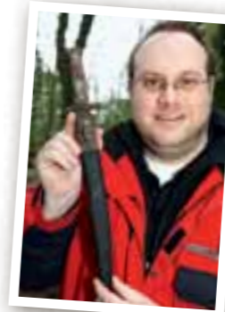
En bajonett som hittades när gerillalägret grävdes ut.

Männen och kvinnorna skulle operera i mindre enheter i olika delar av landet. Frivilligorganisationen kallades Auxiliary Unit, reservförbandet, men hade trots sitt namn en nyckelroll i försvaret. Det var Churchill själv som gav order om att den hemliga armén skulle organiseras. Efter evakueringen från Dunkerque 1940 var premiärministern övertygad