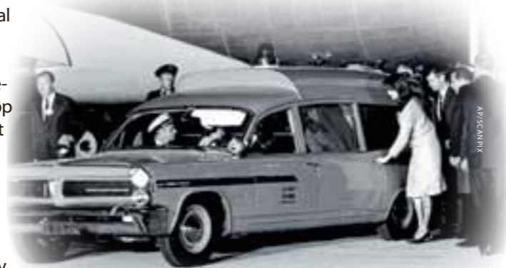
John F Kennedys kropp förs till det väntande presidentplanet och flygs till Washington.

● Nyligen såldes en gammal ambulansbil på auktion i USA. Dess förra ägare hävdar att fordonet transporterade John F Kennedys kropp till flygplatsen efter mordet i Dallas 1963. En veteranbilsorganisation menar dock att det inte kan vara den riktiga bilen eftersom denna troligen förstördes på 1980-talet. Trots det blev slutpriset på ambulansen över 800 000 kronor.