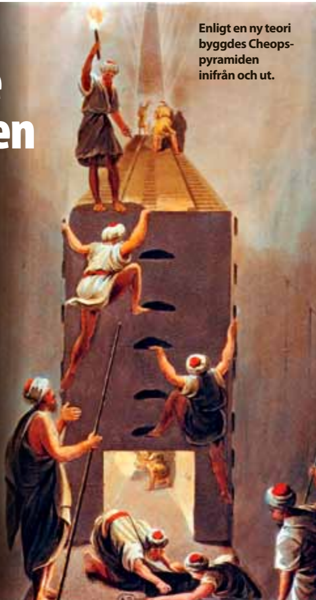
Enligt en ny teori byggdes Cheopspyramiden inifrån och ut.