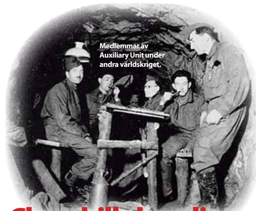
Medlemmar av Auxiliary Unit under andra världskriget.