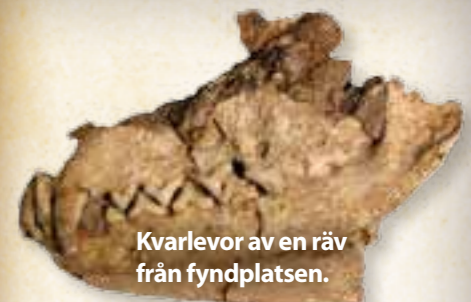
Kvarlevor av en räv från fyndplatsen.

● Nu kan du besöka Versailles utanför Paris, Tate Gallery i London eller Van Gogh-museet i Amsterdam utan att resa dig ur soffan. Det är företaget Google som tillsammans med 17 av världens ledande konstmuseer lanserat Google Art Project, där museerna besöks virtuellt. Det är också möjligt att zooma in på detaljer i tavlorna. www.googleartproject.com